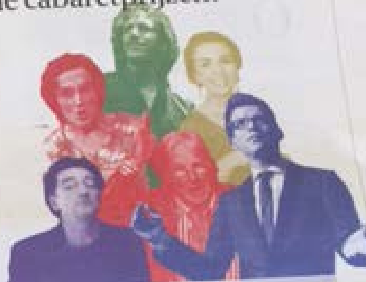
V WEEGT DE KANSHEDDERS V2-4